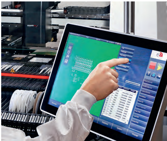
Интерфейс программного обеспечения на центре Essemtec Fox

тельно расширился, у них улучшились характеристики, и в наших установках, включая комбинированные Puma и Fox, могут применяться в том числе очень быстрые и точные струйные пьезоэлектрические дозаторы с производительностью 150 тыс. доз/ч.