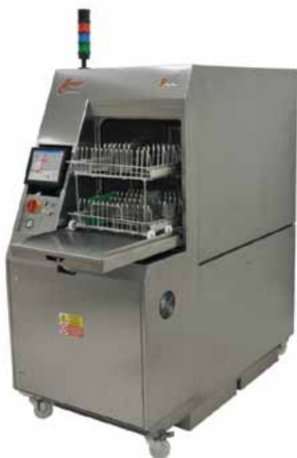
Рис. 1 Система струйной отмывки Comraclean

Принцип работы системы струйной отмывки Comraclean отличается от системы SuperSwash. Хотя обе эти машины реализуют автоматическую струйную отмывку печатных узлов, делают они это по-разному. И если SuperSwash - универсальная система, предна-