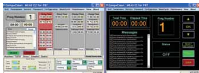
Рис. 4 Система управления Compaclean

что пять литров в цикл, длящийся 30 минут, составят 80 литров в смену, что действительно мало относительно других систем, которые расходуют до 150 литров воды в час.