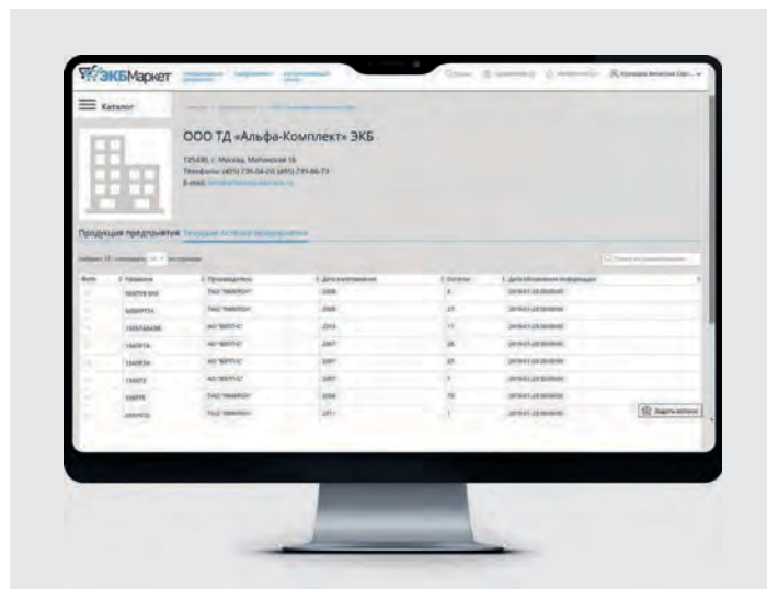
5 Представление информации об остатках на складах

Дополнительный функционал, который получают пользователи «ЭКБ МАРКЕТ», – сервисы Интегрирован-