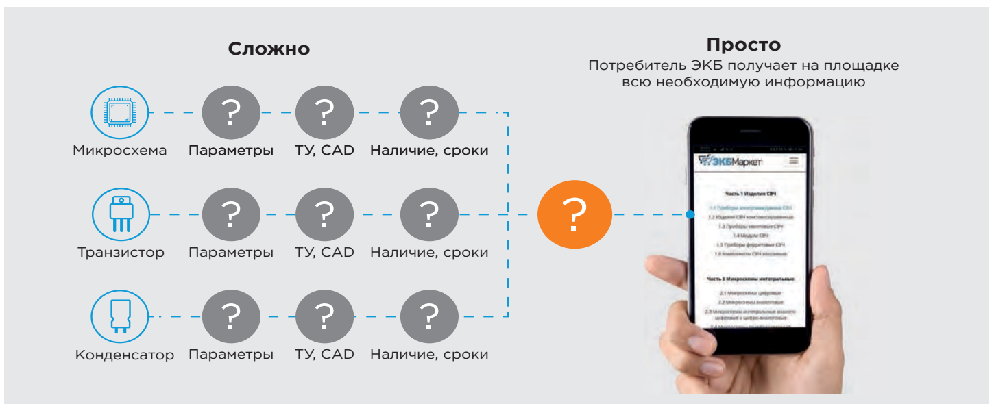
4 Доступность и удобство применения ЭКБ ОП, а не сложность

Спустя год реалии таковы: площадка функционирует и развивает сервисы. Подходы проектной команды в составе сотрудников ФГУП «МНИИРИП», Группы компаний Остек