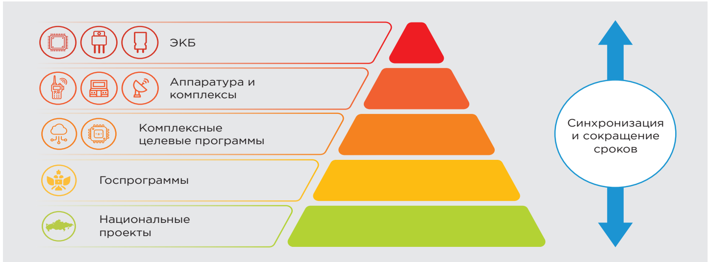
3 От ЭКБ до успешной реализации нацпроектов

ничего не выйдет, и никто не будет на площадку направлять информацию.