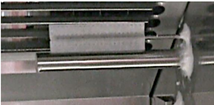
Рис. 4 Мокрый термометр

Сухим термометром является термопара, измеряющая температуру воздуха. Мокрым термометром является термопара со специальным мокрым фитилем. Когда сухой и влажный термометры помещены в воздушный поток климатической камеры, на мокром термометре температура ниже, потому что вода на нем постоянно испаряется, поглощая тепловую энергию. Величина энергии испарения, и, соответственно, конечная температура напрямую связаны с влажностью окружающего воздуха. Микроконтроллер камеры сравнивает температуры на двух термопарах и вычисляет относительную влажность.