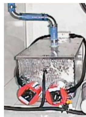
Рис. 2 Генератор пара