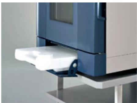
Рис. 1 Канистра для воды